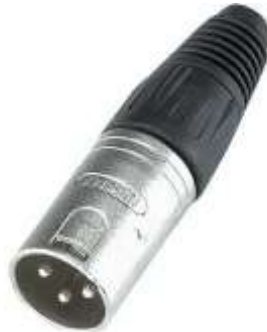
Conector Cannon tipo macho (DMX OUT)