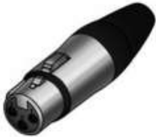
Conector Cannon tipo hembra (DMX IN)