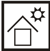
NO EXPONER AL SOL