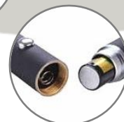
Base para pilas