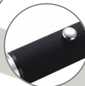
Interruptor de activación