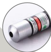
Punta Fina Redonda