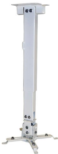
MODO 1. DISTANCIA LARGA